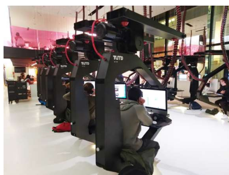
UMO Center for Creative Technologies, TUMO Paris, 2018.

La Biennale di Venezia e il Victoria and Albert Museum, London presentano per il quinto anno consecutivo il Progetto Speciale al Padiglione delle Arti Applicate (Arsenale, Sale d'Armi A) dal titolo Three British Mosques . In collaborazione con l'architetto Shahed Saleem , la mostra guarda al mondo fai da te e spesso non documentato delle moschee adattate a questo uso. Realizzazione della Biennale di Venezia.