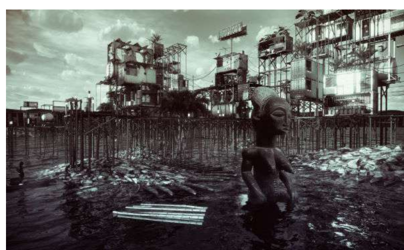
Olalekan Jeyifous and Mpho Matsipa, Liquid Geographies, Liquid Borders, 2020. Courtesy Olalekan Jeyifous

La #BiennaleArchitettura2021 dedica anche quest'anno il progetto Biennale Sessions alle Università, alle Accademie e agli Istituti di Formazione Superiore. L'obiettivo è quello di offrire una facilitazione a visite di tre giorni da loro organizzate per gruppi di almeno 50 tra studenti e docenti, con assistenza all'organizzazione del viaggio e soggiorno e la possibilità di organizzare seminari in luoghi di mostra offerti gratuitamente.