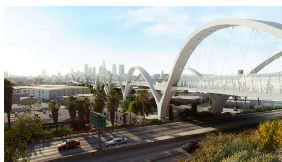
Bureau of Engineering, Michael Maltzan Architecture, Inc. / HNTB Corporation, "City of Los Angeles," Sixth Street Viaduct. Courtesy Michael Maltzan Architecture

63 partecipazioni nazionali animeranno gli storici Padiglioni ai Giardini, all'Arsenale e nel centro storico di Venezia, con 4 paesi presenti per la prima volta alla Biennale Architettura: Grenada, Iraq, Uzbekistan e Repubblica dell'Azerbaijan . Il Padiglione Italia alle Tese delle Vergini in Arsenale, sostenuto e promosso dal Ministero della Cultura, Direzione Generale Creatività Contemporanea, è a cura di Alessandro Melis .