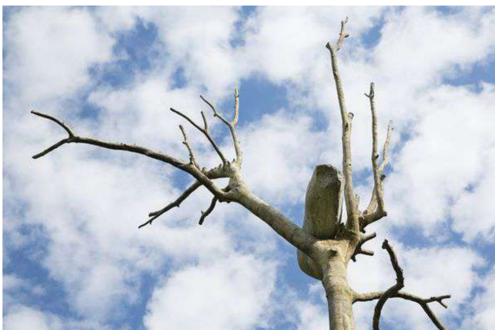
Images: 1- Giuseppe Penone in Venice / 2&3- Giuseppe Penone, Idee di pietra – Olmo (Ideas of Stone – Elm)